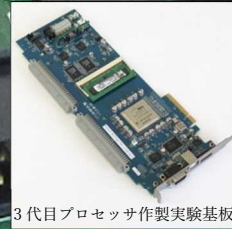
3代目プロセッサ作製実験基板