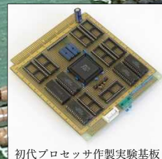
初代プロセッサ作製実験基板