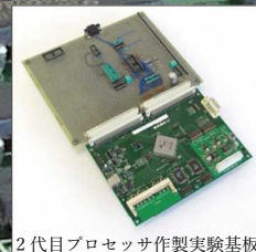
2代目プロセッサ作製実験基板